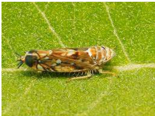
Mérete: 5 mm